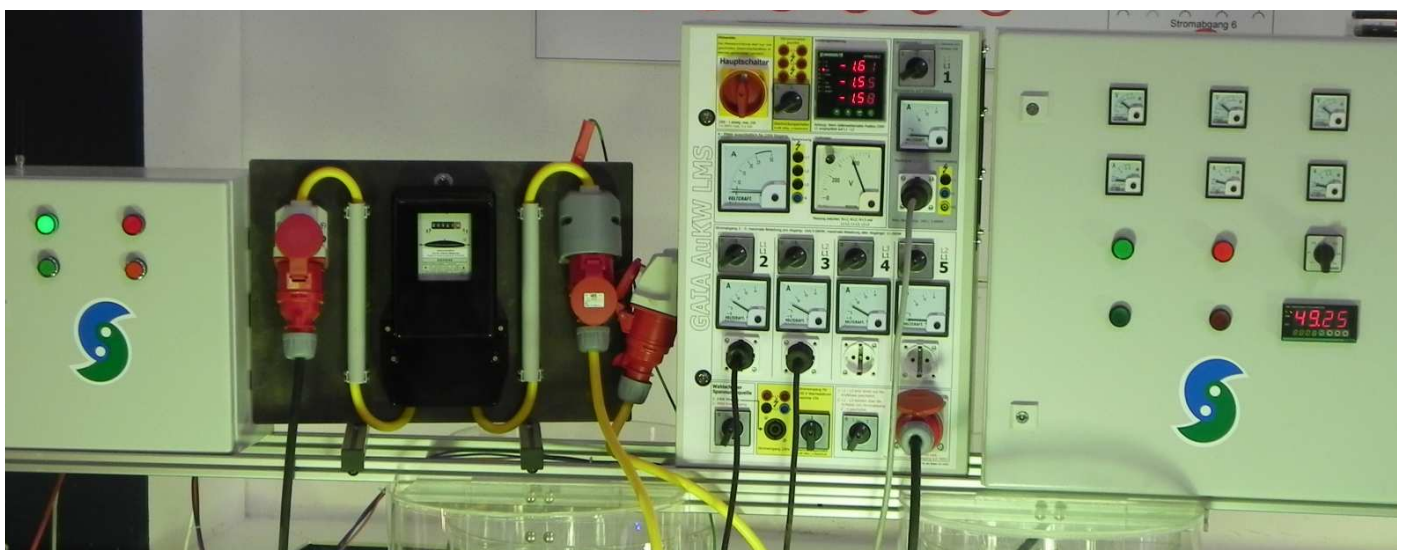
Links Rosch-Schaltschrank mit SPS-Steuerung, daneben Tableau mit Stromzähler, in der Mitte das von GAIA gebaute Kontrollpanel, rechts der originale Rosch-Schaltschrank mit analogen Messinstrumenten und digitaler Frequenzanzeige.

die Drehzahl an der Generatorwelle erfasst. In der Mitte ist der Stromzähler sichtbar, der die gesamte Leistung erfasst, die vom linken Starkstromkabel, das direkt vom Generator kommt, geliefert wird. Der Ausgang rechts führt über ein weiteres gelbes Starkstromkabel zum mittleren Messtableau, das von GAIA selbst geplant und aufgebaut wurde. Dort können die Spannungen, Ströme und Pha-